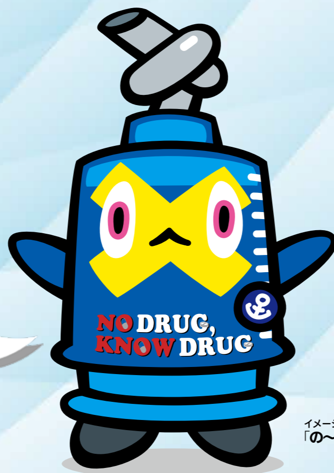
イメージキャラクター「の〜どらくん」

「ダメ。ゼッタイ。」をテーマに、薬物乱用防止の大切さを訴えるポスター作品を募集します。皆さんの「薬物乱用はあぶない!」という気持ちを込めた作品をご応募ください。