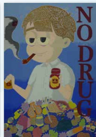
「NO DRUG」 神奈川県立上矢部高等学校美術科2年